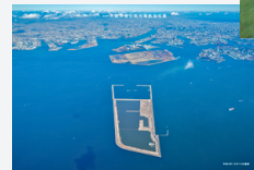
大阪沖埋立処分場